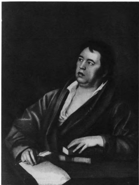
И. А. Крылов.