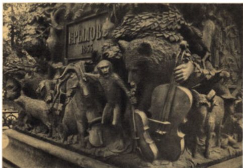
Боковая сторона пьедестала памятника И. А. Крылову в Летнем саду в Петербурге.