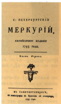
Титульный лист журнала «С.-Петербургскій Меркурий».