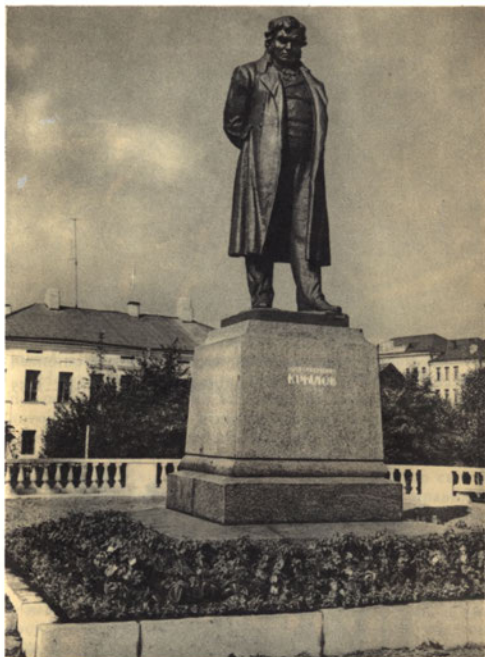
Памятник И. А. Крылову в Калинин. 1959.