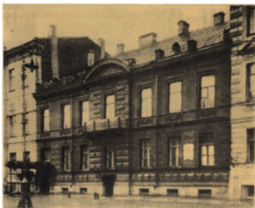
Дом на Васильевском острове в Петербурге, где с 1841 по 1844 год жил и умер И. А. Крылов.