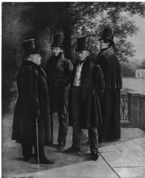
Группа писателей: И. А. Крылов. А. С. Пушкин, В. А. Жуковский, Н. И. Гнедич.