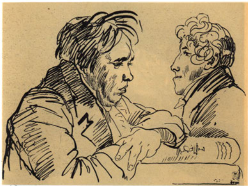
И. А. Крылов и неизвестный.