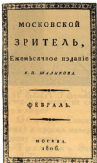
Титульный лист журнала «Московский зритель».